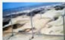
Com linhas, transmissão operando, sete parques eólicos se preparam para