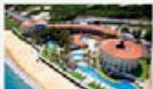
Hotelários comemoram bons resultados de alta estação em Natal.