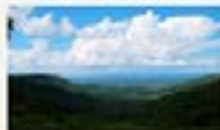
Roteiros alternativos ganham espaço no turismo potiguar