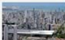
Petróleo e gás aumentam repasses de ICMS